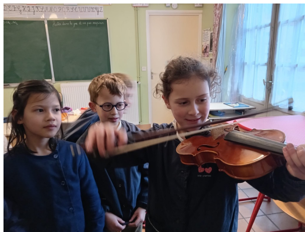
Découverte des instruments de musique