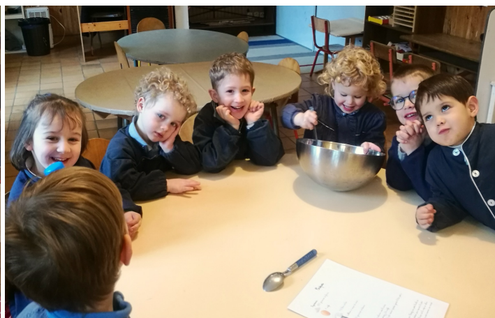
Atelier crêpes pour la Chandeleur