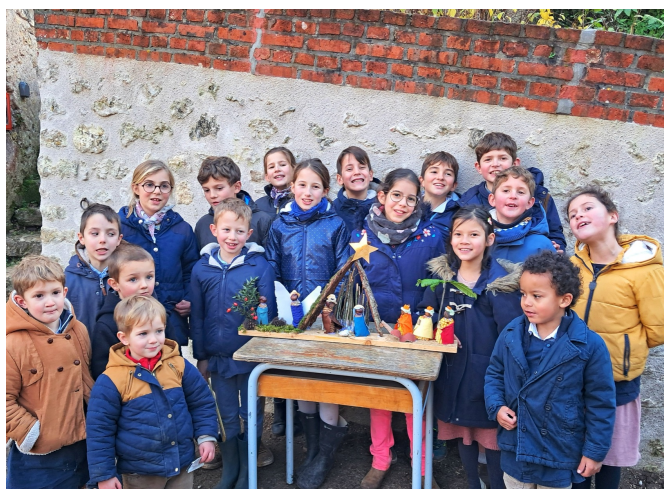
Concours de crèches