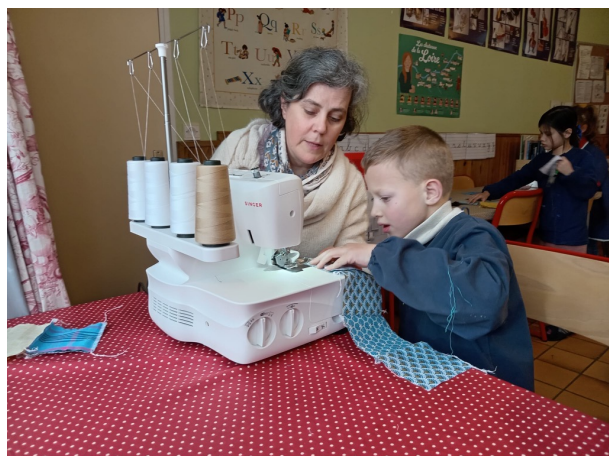
Initiation à la couture en CE