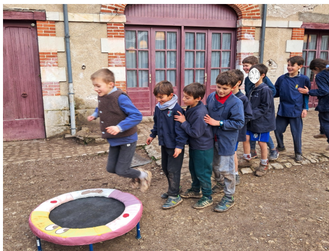
Parcours sportif en CM