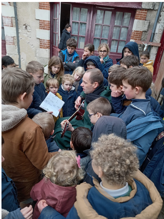
Chants avec monsieur l'abbé